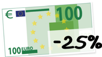
Dotation globale de fonctionnement

Les dotations de l'Etat, les impôts des ménages (taxe d'habitation et taxes foncières), le produit des locations (fermages) et des ventes de bois, les emprunts lorsqu'ils sont nécessaires pour des projets importants et diverses subventions occasionnelles.