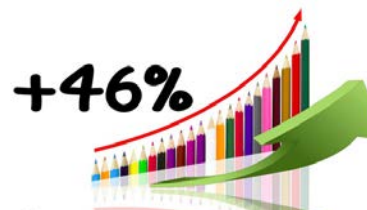
Charges regroupement pédagogique

Une partie importante de ces charges sont aussi liées au fonctionnement des différents syndicats prenant en charge l'exercice ou l'organisation de certaines compétences communales ; C'est le cas du regroupement scolaire pour le plus important, mais c'est aussi le cas du syndicat des eaux ou d'électricité.